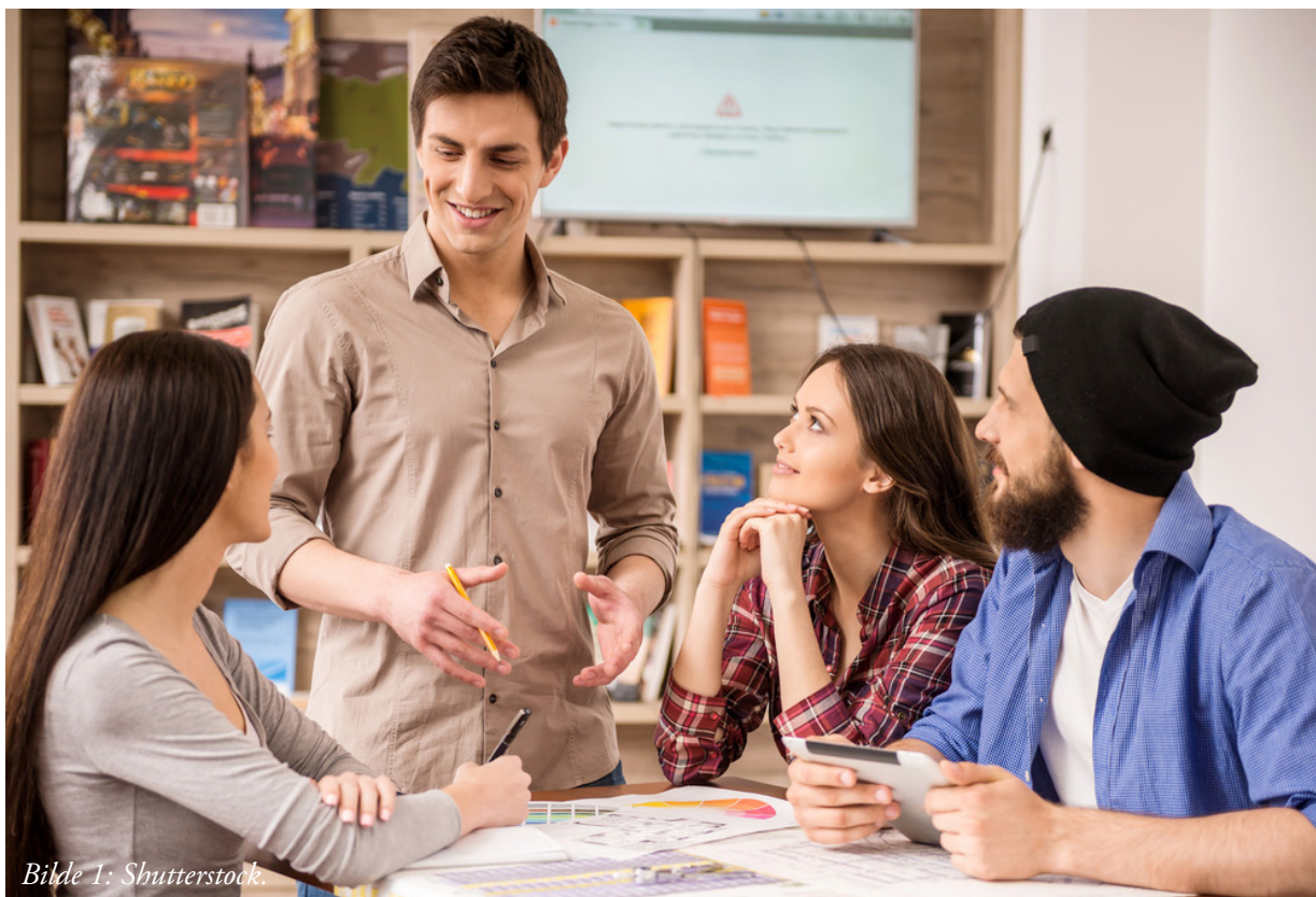
Bilde 1:

Lærerutdanningsinstitusjoner og skoler må være enige om hva som kjennetegner god undervisning. Undervisningen må dessuten tilpasses kunnskap om hvordan barn og unge lærer. En profesjonsutdanning for lærere må ha en faglig kjerne som er relevant for yrkesutøvelsen, praksiser som forbereder på undersøkende aktiviteter i yrkesutøvelsen og et felles begrepsapparat i skoler og lærerutdanningsinstitusjon. Den faglige kjernen fornyes kontinuerlig og består av en etisk plattform, erfaringskunnskap som anerkjennes av profesjonskollektivet og kunnskap fra forskning. En viktig profesjonskompetanse for lærere er å begrunne pedagogiske avgjørelser. Gjennom slike begrunnelser bidrar den enkelte lærer til å støtte utviklingen av et profesjonsspråk, samt til å fornye sin egen praksis og profesjonsgruppens praksis.