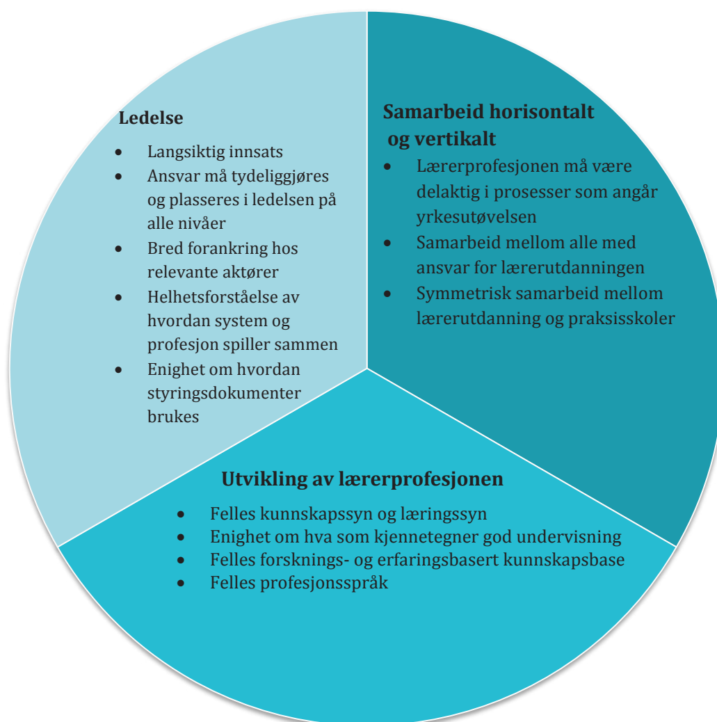
Figur 3. Prinsipper for lærerutdanning som profesjonsutdanning

som angår deres yrkesutøvelse bidrar til å styrke samfunnsmandatet. I tillegg må samarbeidet mellom lærerutdanningsinstitusjoner og praksisskoler være dynamisk og symmetrisk. For produktiv profesjonslæring trengs et felles syn på læring og kunnskap, og det må være enighet om hva som kjennetegner god undervisning. I tillegg må profesjonen ha en felles kunnskapsbase som bygger på forskning og anerkjent god erfaringskunnskap. Sentralt i dette står et felles profesjonsspråk som holder profesjonen sammen og bidrar til å styrke profesjonskollektivet.