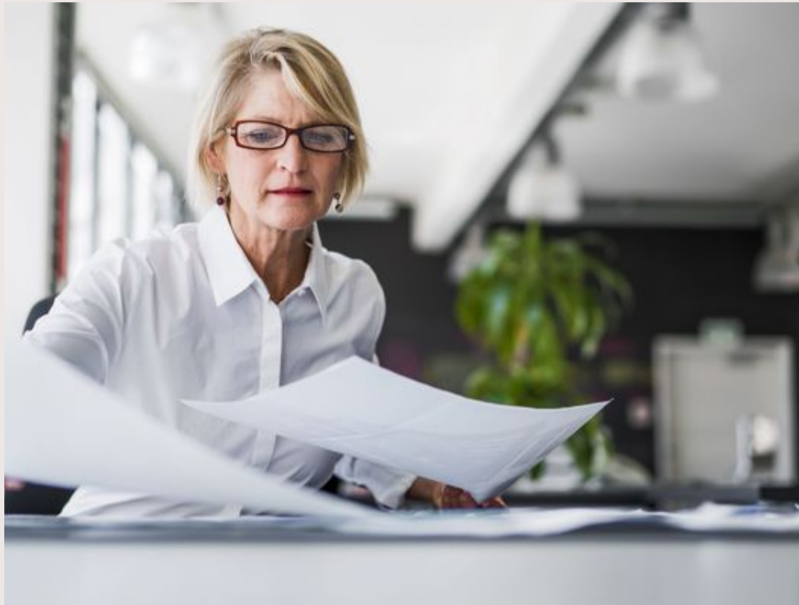
Kvinner gir slipp på muligheter for karriereutvikling til fordel for ekteskap og familie, kommer det fram i en ny studie.

Studien analyserte først karakterene til masterstudenter i økonomi (MBA) på et av de mest prestisjefulle universitetene i USA. Studentene får karakter på deltagelse under forelesningene og de vet at denne karakteren vil stå på vitnemålet. Forskerne fant at ugifte kvinner scorer betydelig lavere på karakteren for deltagelse sammenlignet med gifte kvinner, men fant ikke denne forskjellen blant menn. På andre karakterer, hvor medstudenter ikke kan observere innsatsen, fant de ingen forskjell mellom ugifte og gifte kvinner. Forskerne spekulerte i om de ugifte kvinnene scorer så lavt på deltagelse fordi de er redde for å signalisere karriereambisjoner til de andre i klassen, og dermed ødelegge for mulighetene til å finne en partner.